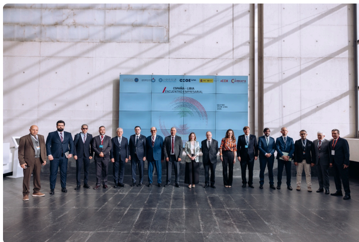
Foto de familia del Encuentro Empresarial España-Libia, Madrid, 23 de abril de 2026.