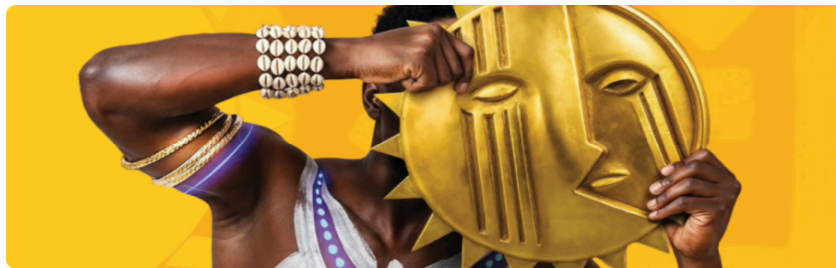
MASA 2026, Marché des Arts du Spectacle d'Abidjan .

Casa África ha coordinado la presencia, del 11 al 18 de abril, de una delegación de instituciones culturales y agentes canarios del sector de las artes escénicas en el MASA 2026 ( Marché des Arts du Spectacle d'Abidjan ), celebrado en Abiyán (Costa de Marfil). El MASA es el principal mercado profesional de las artes escénicas en el África subsahariana y uno de los mayores eventos culturales del continente.