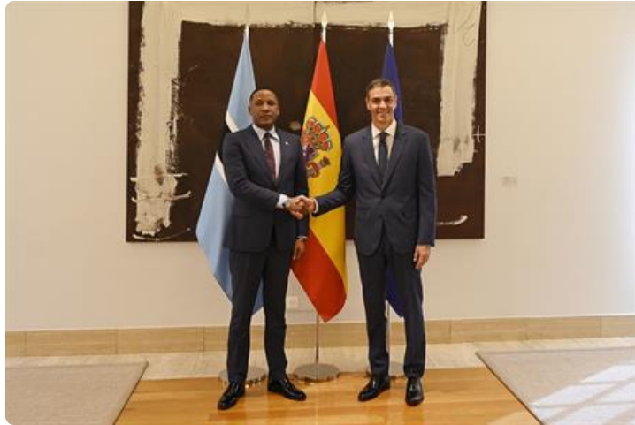
Pedro Sánchez recibe a Duma Gideon Boko en La Moncloa.

El presidente del Gobierno de España, Pedro Sánchez, recibió el 10 de abril en el Palacio de La Moncloa al presidente de la República de Botsuana, Duma Gideon Boko, en la primera reunión bilateral entre ambos mandatarios. Sánchez y Boko coincidieron en reforzar la relación bilateral en el marco de la Estrategia España-África 2025-2028, identificando como ámbitos prioritarios la transición energética, las energías renovables, las infraestructuras y la respuesta común al cambio climático.