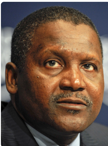
Aliko Dangote, presidente del Grupo Dangote.

El presidente del Grupo Dangote, Aliko Dangote, anunció el 26 de abril en Lagos un plan de expansión que elevará la capacidad de la refinería de Lekki desde los 650.000 barriles diarios actuales hasta 1,4 millones de barriles diarios en un horizonte de tres años, lo que la convertirá en la mayor refinería del mundo, por delante de la india Jamnagar. La ampliación generará alrededor de 95.000 empleos cualificados durante la fase de construcción y se apoyará en ingenieros, técnicos y empresas auxiliares nigerianas.