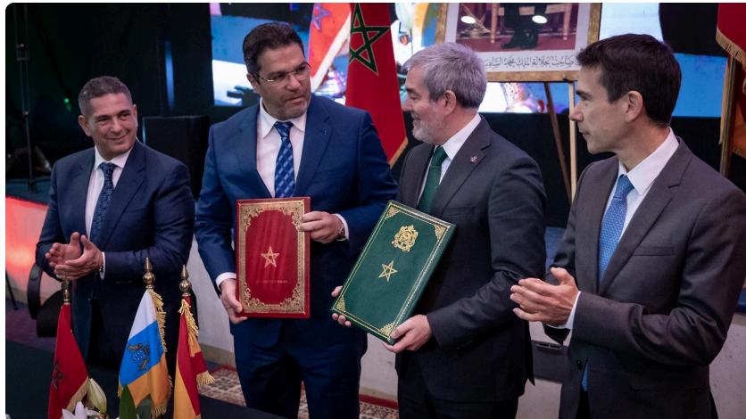
Encuentro institucional Canarias-Souss Massa.

El Gobierno de Canarias ha recibido del 26 al 29 de abril la visita oficial de una delegación institucional de la Región de Souss Massa, encabezada por el presidente del Consejo Regional, Karim Achengli, e integrada por más de cincuenta representantes empresariales, comerciales, académicos y deportivos marroquíes. La agenda ha incluido un encuentro bilateral el 27 de abril entre Achengli y el presidente del Gobierno de Canarias, Fernando Clavijo, además de reuniones sectoriales y encuentros B2B entre empresas canarias y marroquíes.