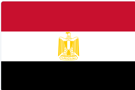
Bandera de Egipto.