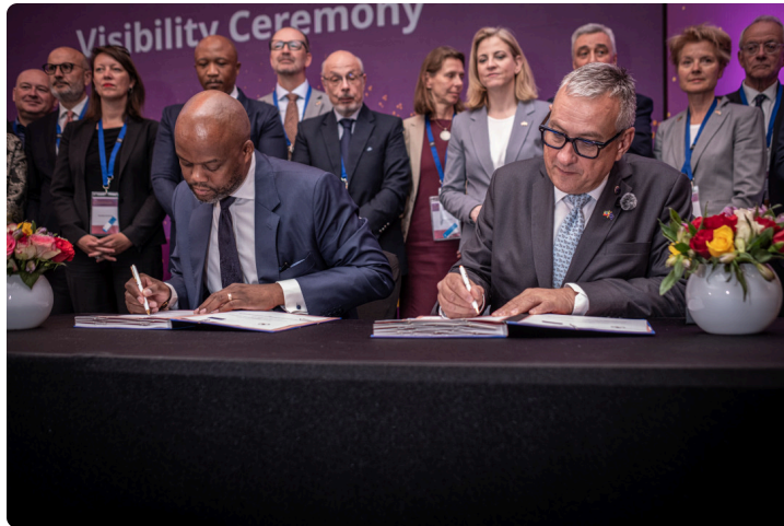
Firma del MoU UE-AfCFTA en Adís Abeba.

El comisario europeo de Asociaciones Internacionales, Jozef Síkela, y el secretario general del Área Continental Africana de Libre Comercio (AfCFTA), Wamkele Mene, firmaron el 20 de abril en Adís Abeba, en el marco del EU-Ethiopia Business Forum, un Memorando de Entendimiento para reforzar la asociación estratégica entre la Unión Europea y el AfCFTA. El acuerdo prevé cooperación en integración económica regional, diálogo político, intercambio de conocimiento y posiciones conjuntas en foros multilaterales.