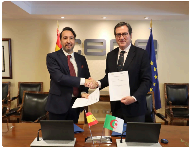
Firma del Memorando de Entendimiento entre CEOE y CREA.

La Confederación Española de Organizaciones Empresariales (CEOE) y el Consejo del Renacimiento Económico Argelino (CREA) firmaron el 9 de abril un Memorando de Entendimiento (MoU) para impulsar las relaciones empresariales entre España y Argelia en sectores como infraestructuras, energía, agricultura, turismo y servicios. Antonio Garamendi, presidente de CEOE, y Kamel Moula, presidente de CREA, se han comprometido a establecer una hoja de ruta operativa centrada en la identificación de sectores prioritarios y en la mejora de la competitividad e internacionalización del tejido empresarial.