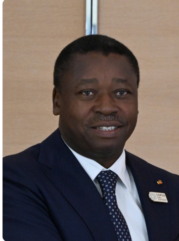
Faure Essozimna Gnassingbé, presidente del Consejo de Ministros de Togo.

El Gobierno de Togo celebró el 18 de abril en Lomé una reunión de alto nivel para presentar su nueva Estrategia Togo-Sahel 2026-2028, bajo el patrocinio del primer ministro Faure Essozimna Gnassingbé y con la participación de enviados especiales para el Sahel de España, Francia, Canadá, Noruega, Portugal, Rumanía, Rusia y Suiza, además de representantes de organizaciones regionales e internacionales y de la sociedad civil. La estrategia se articula en torno a cinco pilares: diálogo político con la Alianza de Estados del Sahel (AES), cooperación regional e internacional, lucha contra el terrorismo, integración económica regional y refuerzo de los corredores logísticos entre el Sahel y el golfo de Guinea.