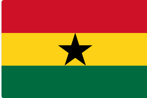
Bandera de Ghana.

El 24 de marzo, Ghana se convirtió en el primer país del continente africano en firmar un acuerdo estratégico de seguridad y defensa con la Unión Europea. El acuerdo fue suscrito por la Alta Representante de la UE, Kaja Kallas, y la vicepresidenta de Ghana, Jane Naana Opoku-Agyemang, y supone un cambio de paradigma en las relaciones UE-África: de la tradicional cooperación basada en la ayuda al desarrollo a una alianza estratégica entre iguales.