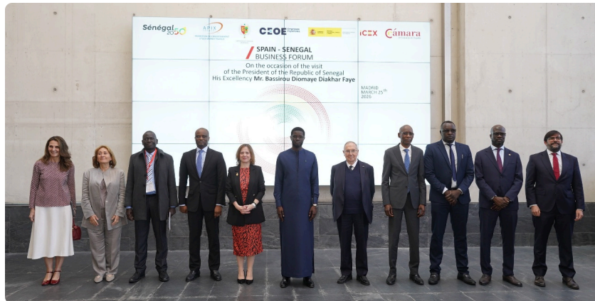
Foto de familia del Spain–Senegal Business Forum con motivo de la visita del presidente Bassirou Diomaye Diakharr Faye, Madrid, 25 de marzo de 2026.

El pasado 25 de marzo de 2026 tuvo lugar el Encuentro Empresarial España-Senegal, que reunió a representantes institucionales y del sector privado de ambos países con el objetivo de fortalecer las relaciones económicas y fomentar nuevas oportunidades de inversión.