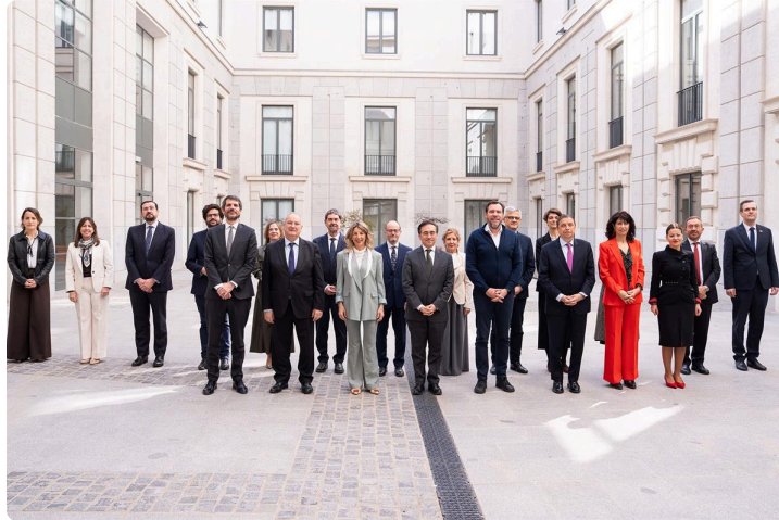
Reunión de la Comisión Interministerial para África (CIMA).

El 19 de marzo, el ministro de Asuntos Exteriores, José Manuel Albares, presidió la reunión anual de la Comisión Interministerial para África (CIMA), con la asistencia de la vicepresidenta segunda Yolanda Díaz y representantes de los ministerios de Transporte, Industria, Turismo, Agricultura, Cultura, Igualdad, Inclusión y Juventud. Se destacó que más del 80 % de las medidas contempladas en la Estrategia España-África 2025-2028 se encuentran ya en fase de ejecución, incluyendo la Alianza África Avanza y los programas de migración circular.